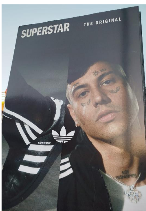
Imagen 11: campaña publicitaria de Adidas con Duki (Av. del Libertador)

El hecho de recrear códigos culturales, plasmando simbologías a través de la piel y fortaleciendo grupos de pertenencia, explica el tránsito del tatuaje de la marginalidad a la centralidad en el imaginario popular. Tanto es así que, actualmente, es posible observar grandes murales y carteles publicitarios en distintos puntos estratégicos de CABA –tales como Av. 9 de Julio, Av. Corrientes, Av. del Libertador y Av. Santa Fe, entre otras– protagonizados por celebridades visiblemente tatuadas, como futbolistas y cantantes: