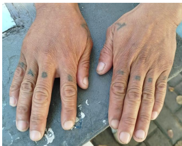
Imagen 4: piezas de tatuaje de usuario del comedor

... las máquinas de tatuaje tumbero se hacen con maquinillas de afeitar y tinta de lapicero. (Usuario del comedor, Imagen 4)