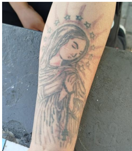
Imagen 3: pieza de tatuaje de usuario del comedor

... andaba haciendo cosas que no se tienen que hacer y me puse esta virgen porque era un matón y, en la jerga de la calle, le dicen la Virgen de los Sicarios (...) estos tatuajes los tengo de hace rato pero, con el tiempo, me di cuenta de que esto está mal... porque La Biblia dice que «no te harás imagen» (...) mi vida cambió (...) esto está mal, nadie tiene que hacerse tatuajes, ni cortes, ni pelear... uno lee La Biblia y cree en lo que lee... yo estoy pasando por ese momento. (Usuario del comedor, Imagen 3)